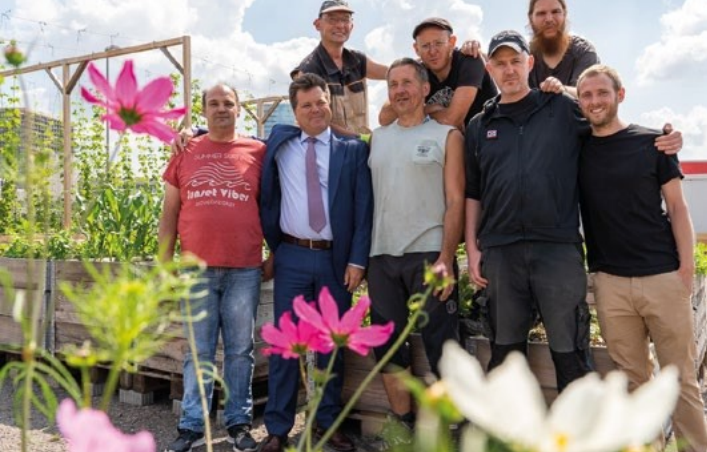
Gruppenbild bei der Gemüsewerft Bremen – einem Zuverdienstbetrieb

In den letzten 22 Jahren stieg der Anteil von Menschen, die aufgrund von seelischer/psychischer Erkrankung frühzeitig in Rente gingen , von 18,6 auf 43 Prozent. Ihr Leistungsvermögen liegt unterhalb von drei Stunden Arbeit täglich. Das bedeutet jedoch nicht, dass Menschen mit einer psychischen Beeinträchtigung oder Suchterkrankung nicht arbeiten können und wollen. Zur Stabilisierung und sozialen Teilhabe benötigen sie jedoch in besonderer Weise Angebote, die auf eine berufliche Eingliederung hinführen . Diese müssen niedrigschwellig und am individuellen Bedarf ausgerichtet sein und tagesstrukturierend wirken. Werkstätten für behinderte Menschen (WfbM) können diesen Rahmen häufig nicht bieten.