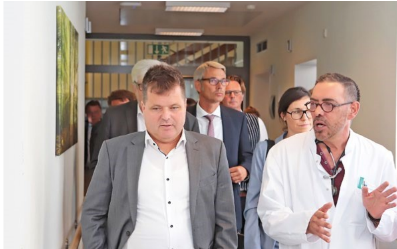
Jürgen Dusel zu Gast im Krankenhaus Mara in Bielefeld

tungsorganisationen von Menschen mit Behinderungen erarbeitet werden.