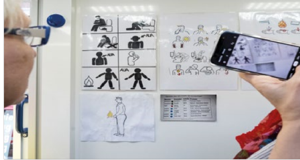
Ein Blick ins Krankenmobil der Caritas Hamburg. Zu sehen sind Erklär-/Zeigetafeln für beispielsweise Menschen, die sich nicht oder nur schwer mit Sprache verständigen können

Alle Gefahren, Risiken und Probleme, mit denen wohnungs- und obdachlose Menschen zu kämpfen haben, treffen erschwert auch auf Menschen mit Behinderungen zu. Bislang fehlt es jedoch an einer systematischen wissenschaftlichen Analyse des Themas Wohnungslosigkeit und Behinderung . Hier zeigt sich eine Forschungslücke, die dringend geschlossen werden muss. Denn nur auf der Grundlage empirischer Daten lassen sich pass-