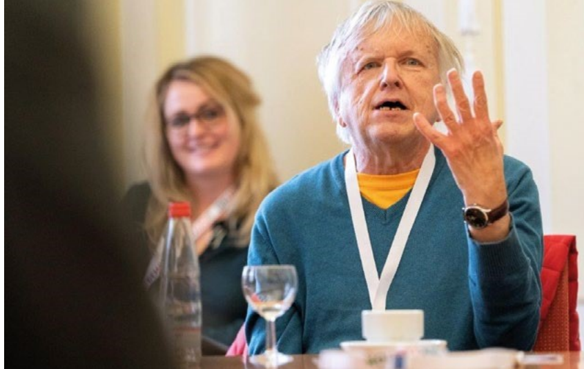
Willi Jakob von Einfach Heidelberg e. V. berichtet von den digitalen Projekten auf dem inklusiven Nachrichtenportal www.einfach-heidelberg.de

freiheit ist die Grundlage für die umfassende Information und Teilhabe aller Bürger*innen – egal ob mit oder ohne Behinderungen. Für öffentliche Stellen sind das Behindertengleichstellungsgesetz und die Barrierefreie-Informationstechnik-Verordnung (BITV 2.0) mittlerweile eindeutig: Sie sind verpflichtet, ihre digitalen Angebote barrierefrei zu gestalten.