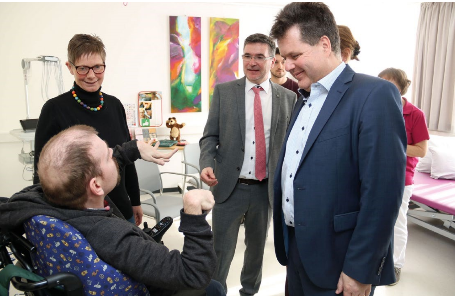
Jürgen Dusel zu Gast im Medizinischen Behandlungszentrum für erwachsene Menschen mit komplexer Behinderung in Würzburg – hier im Gespräch mit Mitarbeiter*innen und einem Patienten des MZEB