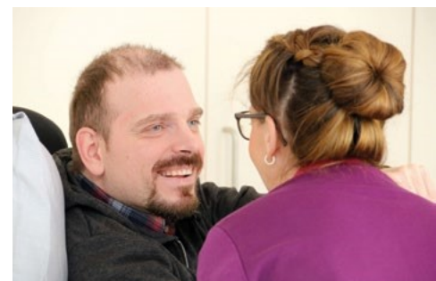
Patient und Ärztin im MZEB Würzburg

Ein gutes Gesundheitssystem ermöglicht allen den Zugang zu den medizinischen und therapeutischen Leistungen, die sie benötigen. Für viele Menschen mit Behinderungen gilt dies leider noch nicht. In der UN-Behindertenrechtskonvention (UN-BRK) verpflichten sich die Vertragsstaaten in Artikel 25, Menschen mit Behinderungen eine ortsnahe gesundheitliche Versorgung in derselben Bandbreite und von derselben Qualität zu garantieren wie Menschen ohne Behinderungen. Zusätzlich sollen sie die Leistungen der gesundheitlichen Versorgung erhalten, die sie wegen ihrer Behinderung benötigen.