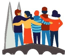
Buddy Programm Universität Regensburg

Schreibe dazu einfach eine kurze E-Mail mit deinem Namen und deinem Studiengang an international.startklar@ur.de