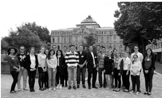
Besuch des Bundesgerichtshofs in Karlsruhe

Durch Vorträge und Diskussionsrunden zu aktuellen rechtlichen und politischen Themen, Kanzleiführungen und Exkursionen blickt ELSA Regensburg über den „Tellerrand“ des Studiums hinaus und bietet so die Möglichkeit, neue Erfahrungen zu sammeln und seinen Horizont zu erweitern. Insbesondere durch Moot Courts in verschiedenen Rechtsgebieten, wobei Studierende in die Positionen der Verfahrensbeteiligten schlüpfen, lässt sich Praxisluft schnuppern.