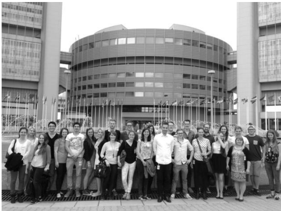
Besuch der Vereinten Nationen in Wien

Als Vorreiter für die universitäre Ausbildung bietet ELSA studienbegleitend sowohl akademische als auch stark praxisbezogene Aktivitäten inklusive Auslandserfahrung, internationaler Kommunikation, Organisation von Projekten und Soft Skills.