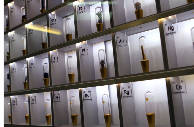
Periodensystem im Foyer der Fakultät für Chemie und Pharmazie

Im Zentrum des Chemiestudiums stehen neben den Vorlesungen intensiv betreute Laborpraktika an der Universität, in denen das erworbene theoretische Wissen sofort angewandt wird. Die Theorie-Module werden mit benoteten Prüfungen abgeschlossen, die schriftlich oder auch mündlich abgelegt werden. Fachpraktische Ausbildungsteile bleiben unbenotet.